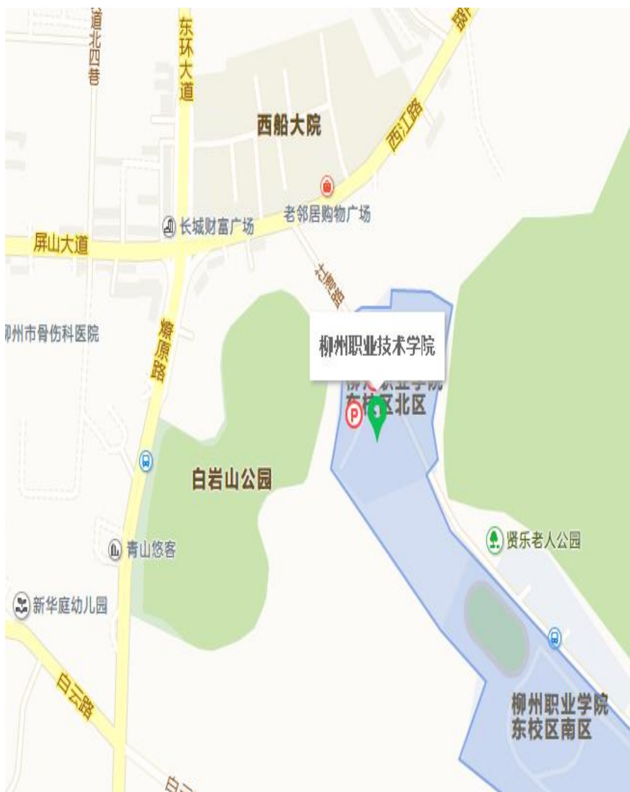
柳州职业技术学院社湾校区（本部）D区（位置图示）